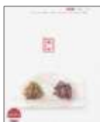
↑西利様ウェブサイト